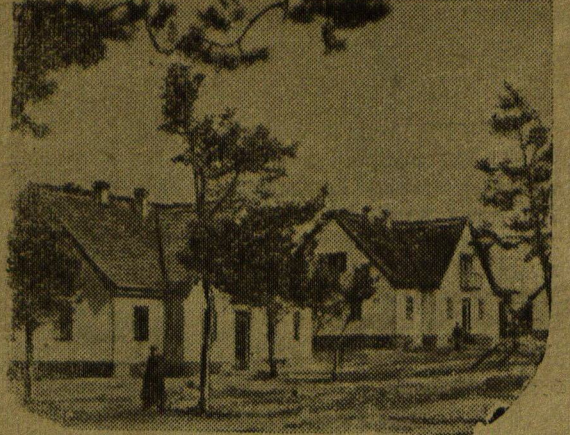
МИНСК — столица Советской Белоруссии, разрушенный немецко-фашистскими оккупантами, быстро восстанавливается. Встают из пепла и руин общественные здания и жилые дома, начаты сотни новостроек. На снимке слева: клинический городок в Минске. # На снимке справа: вновь построенный поселок для рабочих Минского тракторного завода.